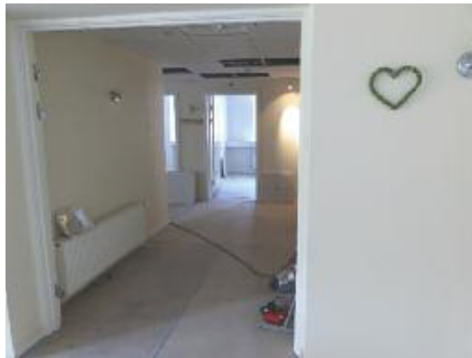
Ånden i huset bevarer.