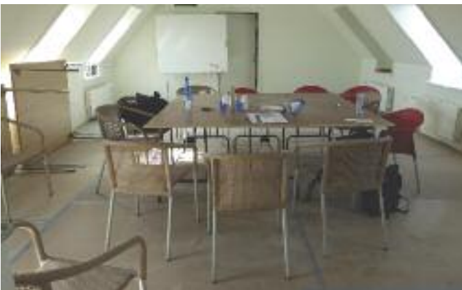
Frokoststuen - det eneste sted, hvor der var ro og fred.