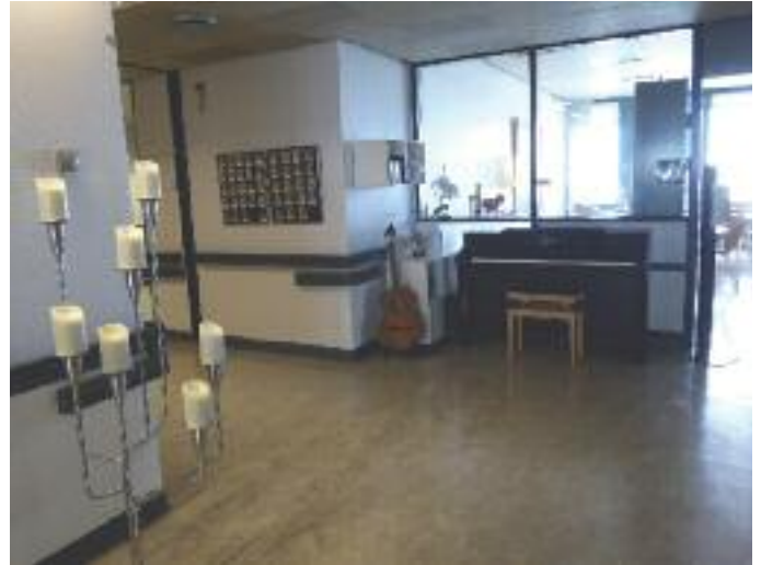
Sang- og gudstjenesteplass, medens Hospice er på Sygehuset.