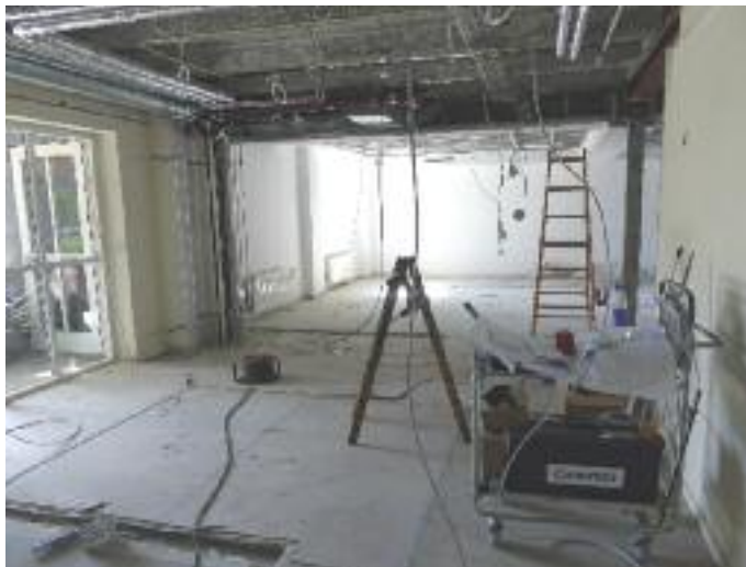
Opgradering af Hospice Sydvestjylland.