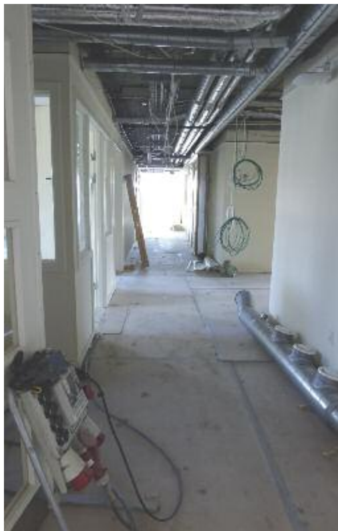
Til daglig ser vi ikke, hvad der gemmer sig bag ved væggene og under loftet.