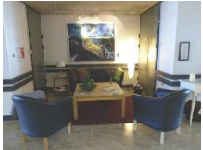
Stor ros til de Hospiceansatte for deres arbejde med at bibeholde kulturen i overgangstiden på sygehuset.