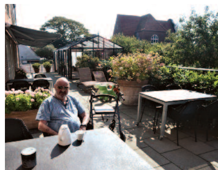
Have og terrassen er et yndet sted at være i godt vejr.

Hospice Sydvestjylland er en selvejende institution, hvis formand er tidligere